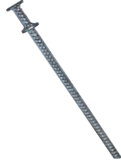
PIQUET À GLACE, ROCK ET BÉTON