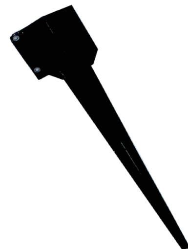
PIEUX POUR 4X4 (STANDARD)