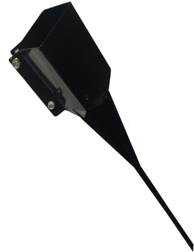
PIEUX POUR 4X4 (4 SAISONS)